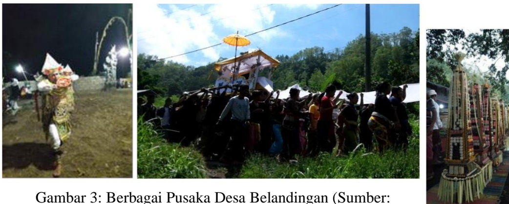
Gambar 3: Berbagai Pusaka Desa Belandian

Namun pola tradisional sekarang terancam dimana pada tahun 2017 desa Belandian mendapatkan bantuan perumahan dari pemerintah baik dalam bentuk pembangunan rumah baru atau stimulan perumahan swadaya (Arcana, 2018). Tak hanya rumah tradisional, masih banyak pusaka yang dimiliki oleh desa Belandian seperti yang terlihat pada gambar.