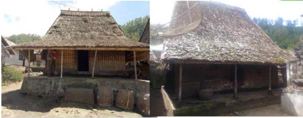
Gambar 2: Rumah Tradisional Belandian

Namun pola tradisional sekarang terancam dimana pada tahun 2017 desa Belandian mendapatkan bantuan perumahan dari pemerintah baik dalam bentuk pembangunan rumah baru atau stimulan perumahan swadaya (Arcana, 2018). Tak hanya rumah tradisional, masih banyak pusaka yang dimiliki oleh desa Belandian seperti yang terlihat pada gambar.