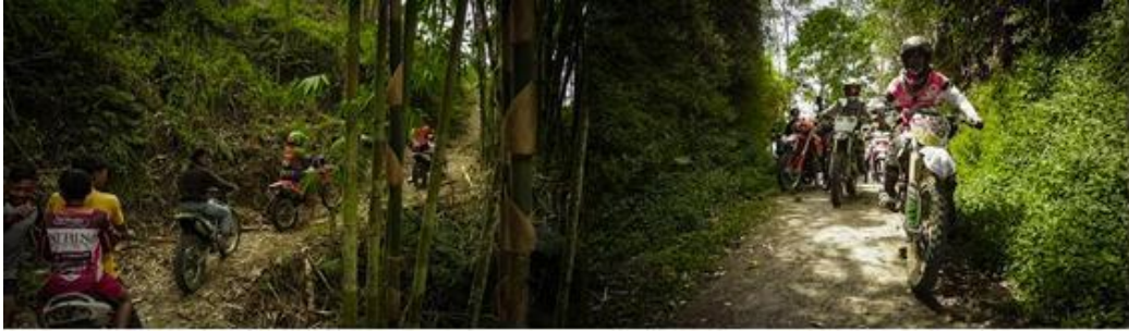
Gambar 4: Uji Coba Track Yang Dilakukan Oleh STT dan Anggota Ikatan Motor

penyelenggaraan eventnya sudah terjadwal dan terorganisir dengan baik sehingga masyarakat Desa Belandingan khususnya para pemuda-pemudinya bisa belajar tentang pengelolaan suatu event.