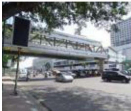
Gambar 3. Jembatan Penyeberangan

Penghunian lahan LM pertamakali berlangsung pada tahun 2003 di sisi Timur, ketika Pemko Medan mengembangkan program pariwisata, dan membangun infrastruktur bagi pejalan kaki di tengah kota dengan merevitalisasi jembatan penyeberangan Titi Gantung yang berada di sisi Selatan gedung stasiun. Kemudian menata areal Titi Gantung agar jalur pejalan kaki di Titi Gantung nyaman digunakan pengunjung. Para pedagang buku yang berada area di sisi timurnya kemudian direlokasi ke sisi Timur LM.