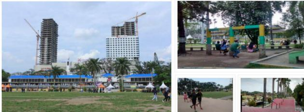
Gambar 7. Berkembangnya pemanfaatan Lapangan Merdeka selain tempat acara resmi pemerintahan juga sebagai sarana berolah raga, bermain, berjualan, bahkan tempat rekreasi

Pada akhir tahun 2014, setelah Bandara Kuala Namu International Airport (KNIA) beroperasi, dibukalah jalur kereta api dari stasiun KA ke bandara KNIA. Pemko Medan menawarkan kepada PT KAI dibangun parkir city Railink di sisi Timur LM. Setelah proses pengerjaan-clearing site-berlangsung di lapangan, kemudian BWS, DHC 45 Medan dan komunitas taman menyurati Walikota dan DPRD Medan menolak pembangunan sarana parkir tersebut, serta menulis di berbagai media massa.