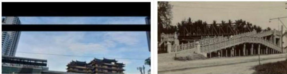
Gambar 14. Stasiun klenteng dan rel layang (2019) dan Titi Gantung Lama (1927)

Sisi utara jalan Kantor pos dan jalan Bukit Barisan –sebelumnya Societietweg-, dibangun kantor pos (1909). Sebelahnya ada gedung Witte Societeit (White colars) era Jepang menjadi tempat para serdadu Gyugun Jepang dilatih. Zaman kemerdekaan milik BPOM dan kemudian sekarang sudah berubah menjadi gedung Bank BCA.