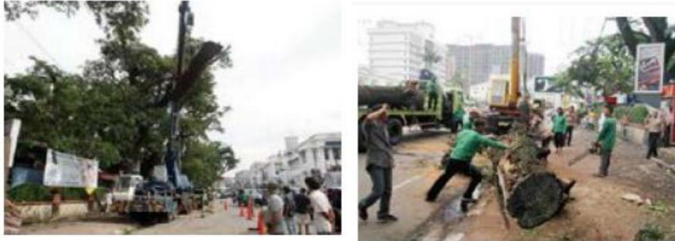
Gambar 9. Pohon trembesi di sisi Utara Barat Laut tumbang, 13 Januari 2017

tempat yang sama, dan dua (2) batang pnah. Total yang sudah pnah (7) batang.