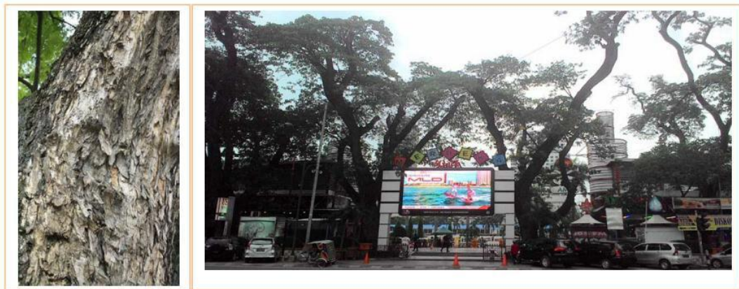
Gambar 10. Kondisi pohon Albizia Saman. Atau Albizia Saman bahasa latin artinya pohon trembesi, dalam bahasa Inggris dikenal dengan nama rain tree (baca: ki -hujan). Didatangkan dari Afrika Selatan sekitar tahun 1875 dan ditanam di tiga sisi

Bahkan pemanfaatan tanah LM oleh MW membuat permukaan tanah di sisi Barat seluas 85% menjadi tertutup bangunan dan keramik. Luas penampang permukaan tanahnya tidak bisa lagi menyerap air hujan secara maksimal dari permukaan tanah.