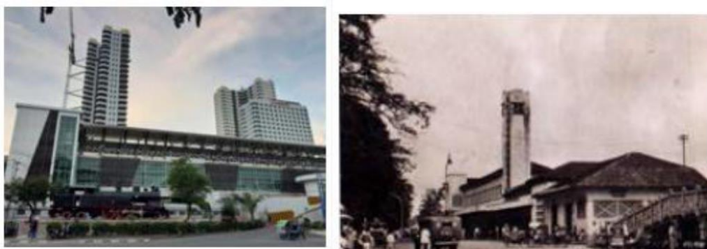
Gambar 13. Stasiun KNIA dan Gedung Stasiun Kerata Api Lama (1885)

Hotel De Boer (1910)-Hotel Dharma Deli (1990)-, waktu Letnan Raymon Westerling (September, 1945) datang ke Sumatera Timur mengingat di