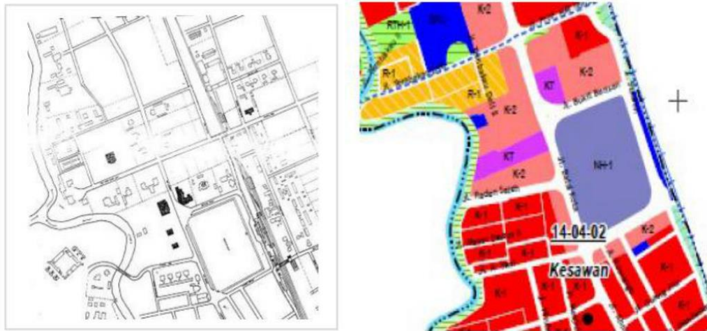
Gambar 1a. Peta Lap. Merdeka & posisi pertemuan Sungai Deli-& Sungai Babura. Lap. Benteng, Esplanade, Deli Maatskapijt, Hotel De Boer, City Hall, Stasiun KA, Kantor Pos & bangunan lainnya 1b Peta Lapangan Merdeka saat ini & sekitarnya

penyelamatan dengan advokasi public dan sekaligus mengedukasi masyarakat luas tentang status dan fungsi lapangan Merdeka (LM) sebagai warisan tua kota Medan. Dengan harapannya untuk membangunkan kemauan/semangat berbagai pihak untuk melestarikan LM dan kawasan sekitarnya (khususnya) secara berkelanjutan.