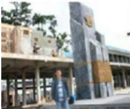
Gambar 5. Monumen Perjuangan Kemerdekaan (1986-2016)