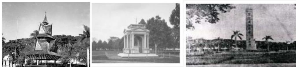
Gambar 8 .Rumah Siwaluh Jabu (1912), Monumen Tamiang (1923), Monumen para serdadu Jepang yang gugur di Medan Perang (1943)

Bukan itu saja, sejak sarana parkir beroperasi pertengahan tahun 2017, areal disekitar pelataran monumen dimanfaatkan oleh para pedagang makanan awalnya di hari Minggu dan acara tertentu, akhirnya menjadi setiap harinya.