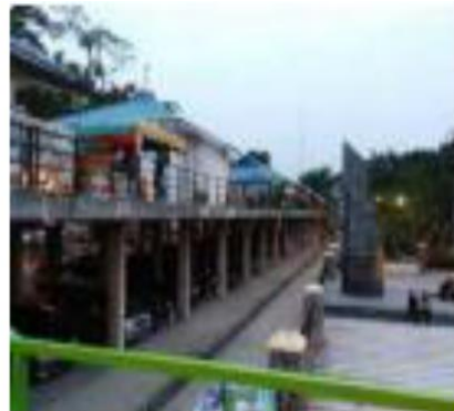
Gambar 4. Kios Para Pedagang Buku