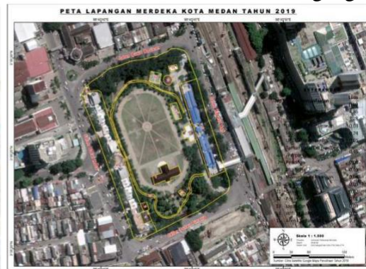
Gambar 6. Peta Lapangan Merdeka Kota Medan Tahun 2019

Berlanjut pada tahun 2005, setelah kantor Walikota Medan dari jalan Balai Kota Medan dipindah ke jalan Kapten Maulana Lubis Nomor 02 Medan tahun 1990, kemudian dibangun Kesawan Square (KS). Beberapa tahun kemudian KS mendapat penolakan dari masyarakat sekitarnya, lalu ditutup.