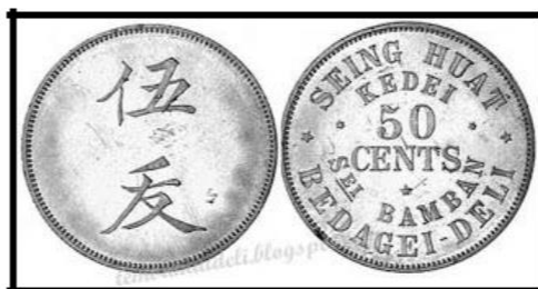
Gambar 2: Mata uang Kedai Seing Huat Sei Baman