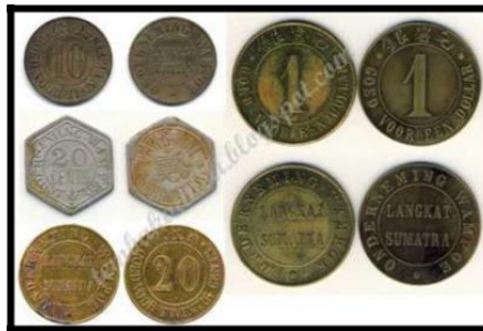
Gambar 5: Macam-macam mata uang dari Onderneming Wampoe

Perkebunan Wampoe adalah perusahaan perkebunan tembakau swasta, perkebunan tua Batu Mandi, yang memiliki 5000 bangunan, terletak di Residen Sumatra Timur, wilayah Deli, Langkat, pada ketinggian sekitar "100 kaki Rhineland Atas (sekitar 30m.) dari permukaan laut. Mata uang yang beredar pada periode sekitar 1888-1892. Dari perkebunan ini ada token palsu yang relatif cukup banyak, sehingga ada terlihat perbedaan yang nyata dibandingkan dengan yang palsu.