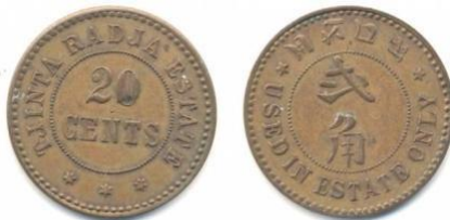
Gambar 7: Mata uang 20 cents, brass Bagian depan tertulis USED IN ESTATE ONLY - bagian belakang aksara Cina

Perkebunan Tembakau Tjinta Raja Estate, berdekatan dengan Kampung Iney, terletak di Sumatera Timur, Divisi Deli, Langkat Beneden , di wilayah Stabat-Langkat, "9 tiang" atau sekitar 15 km dari Stabat dan trem berhenti "4 tiang" dari Tandjoeng Poera. Mata uang periode mengeluarkan token 1876 – 1883. Koin perkebunan terdiri dari (1) koin 10 cent, terbuat dari red copper , 24 mm; (2) koin 20 cent, terbuat dari kuningan, 27 mm.