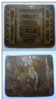
Gambar 6: Mata uang dari onderneming Bahorok . Koin Bahorok dari perkebunan karet yang ada di Langkat yang masuk dalam Karesidenan Sumatera Timur. Pada tahun 1888 Dutch East Indies