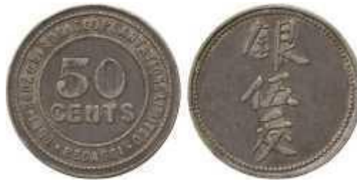
Gambar 1: 50 cent Koin Perkebunan Deli-Bedagei Plantation Limited

Deli - Bedagei Plantation Limited adalah sebuah perkebunan yang terletak di Bedagei, wilayah Serdang, Keresidenan Sumatra Timur. Tak diketahui kapan koin ini diedarkan.