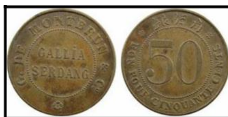
Gambar 3: Mata uang Gallia

Mata uang bertuliskan BON POUR CINQUANTE CENTS—bahasa Perancis. Perkebunan Gallia berada di Boven Serdang, sekitar 9 km dari stasiun Bangoen Poerba, termasuk Karesidenan Sumatera Timur. Koin berlaku tahun 1890 - 1896/1897, terbuat dari bahan tembaga dengan ketebalan mata uang 30-33 mm (... de Gallia plantage lag in de Residentie Oostkust van Sumatra, afdeling boven-Serdang, op een afstand van ca. 9 km. van het station Bangoen Poerba. Periode uitgifte tokens 1890 - ca. 1896/97... ).